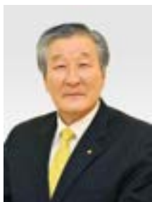
社団法人 韓国慢性期医療協会 医療法人 喜縁医療財団